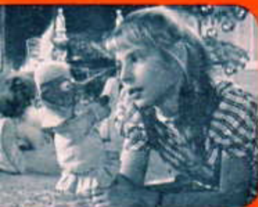
Une possibilité de prise de vue

Vous voyez que les images s'inscrivent sur un dépoli à leurs dimensions réelles. Par simple réglage - comme avec une paire de jumelles - vous obtenez une vision nette, piquée à l'extrême... ou non, si vous le désirez ! Vous pouvez donc, pendant que le film se déroule, modeler, corriger, cadrer, parfaire vos images à votre gré. Or le film enregistrant exactement ce que vos yeux ont voulu , il est évident que cette vision et ce contrôle permanent de votre propre film ne peuvent aboutir qu'à sa réussite certaine... et cela, vous le savez déjà en filmant.