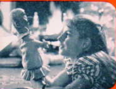
Autre possibilité offerte par la visée réflexe Beaulieu avec une mise au point différente.

P our réussir vos films, une des conditions essentielles est la visibilité. Intégrale, parfaite. Tous les perfectionnements techniques sont sans objet si cette condition n'est pas remplie. C'est pourquoi Beaulieu s'est penché particulièrement sur ce problème en équipant toutes ses caméras de la visée réflexe.